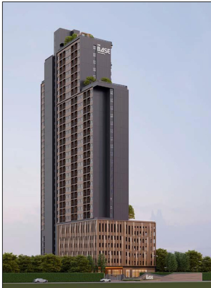
รูปที่ 2-3 ภาพจำลองโครงการ

การจัดภูมิสถาปัตยกรรมมีทั้งส่วนที่เป็นภูมิทัศน์แข็ง (Hardscape) และภูมิทัศน์นุ่ม (Softscape) โดยแนวคิดการจัดภูมิสถาปัตยกรรมในส่วนของ Hardscape ส่วนใหญ่เป็นการตกแต่งพื้นผิวของทางเดินบริเวณอาคาร ส่วนแนวคิดการจัดภูมิสถาปัตยกรรมในส่วนของ Softscape นั้นเน้นการตกแต่งโดยปลูกไม้ยืนต้นและไม้พุ่ม เพื่อเพิ่มความร่มรื่นของพื้นที่ ช่วยลดความกระด้างของโครงสร้างอาคาร ต้นไม้จะช่วยทอนสัดส่วนของอาคาร และลดผลกระทบต่อทัศนียภาพของผู้สัญจรไปมาได้อีกด้วย